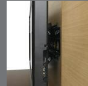
CONSOLE : BRANCHEMENT ÉCRAN