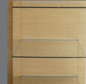
VITRINE MURALE : TABLETTES EN VERRE