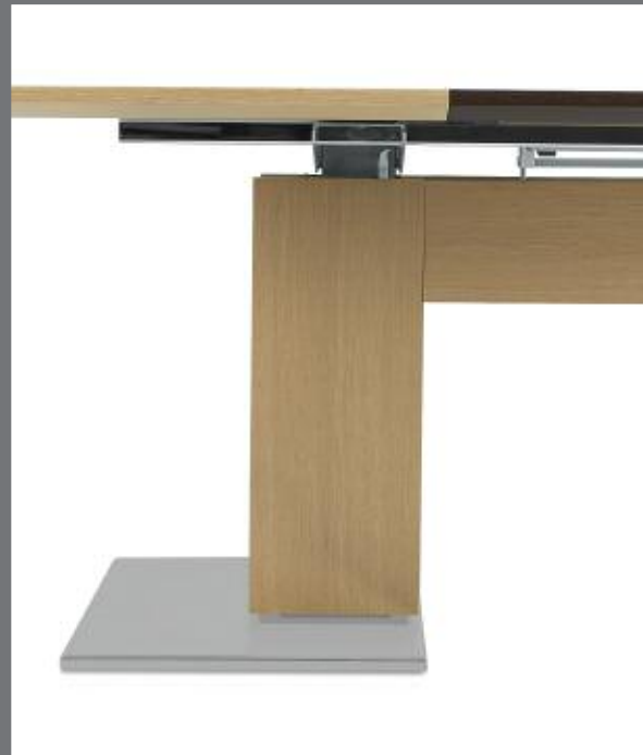
TABLE : CEINTURE