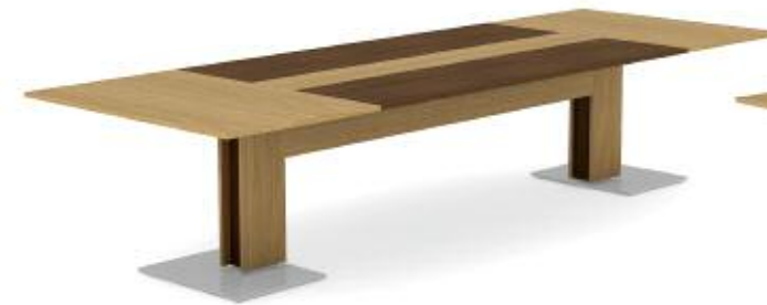
MODULAIRE AVEC CENTRE TECHNO INTÉGRÉ À PORTES D'ACCÈS AGENCÉS