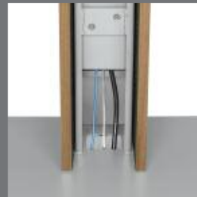
TABLE : GESTION DE CÂBLES