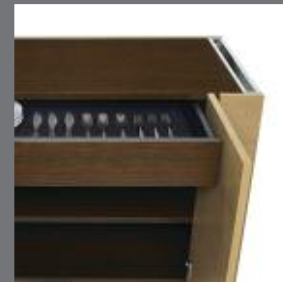
CHARIOT DE SERVICE : TIROIR À COUVERTS