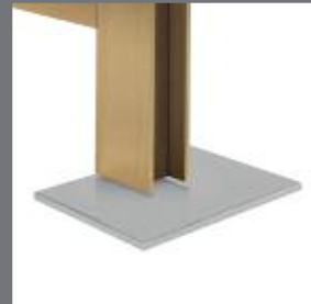
TABLE : BASE ET PIED