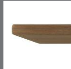
TABLE : CHANT