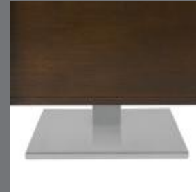
CONSOLE : BASE