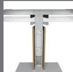
TABLE : PIED À HAUTEUR RÉGLABLE