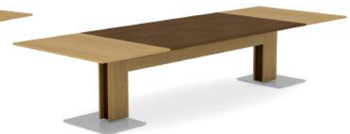
MODULAIRE AVEC CENTRE TECHNO INTÉGRÉ À PORTES D'ACCÈS CONTRATANTS

LES CONSOLES SONT ILLUSTRÉES (À GAUCHE) EN BISCOTTI (BTW) ET MOKA (MCW) AVEC DES BASES FINIES SOUPÇON D'ARGENT (GSR) ET (À DROITE) EN NOYER LÂTTE ET NOYER CACAO AVEC DES BASES FINIES SOUPÇON DE FER (IGR). LES TABLES SONT ILLUSTRÉES (DE GAUCHE À DROITE) EN BISCOTTI (BTW) ET EN BISCOTTI (BTW) ET MOKA (MCW); TOUTES LES TABLES PRÉSENTENT DES BASES FINIES SOUPÇON D'ARGENT (SGR).