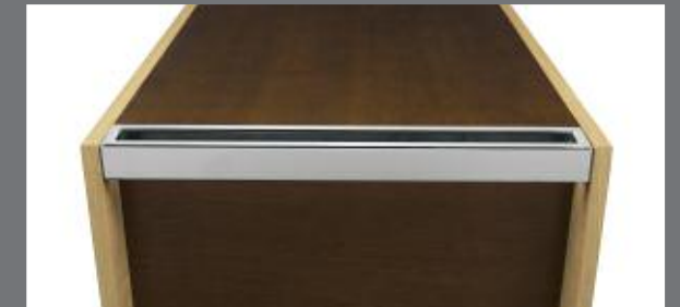
CHARIOT DE SERVICE : POIGNÉE