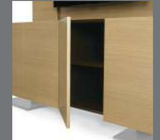
CONSOLE : TABLETTE RÉGLABLE